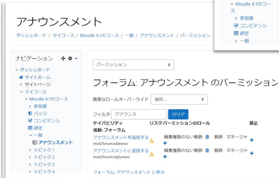
B) ↑ パーMISSIONの設定(教師ロール)