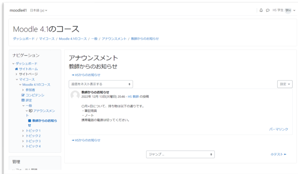
A) ↑ アナウンスメント(返信不可)