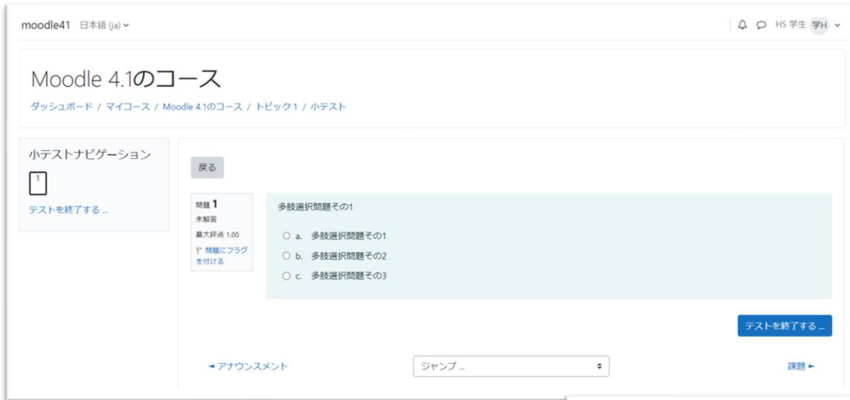
A) ↑ 小テスト