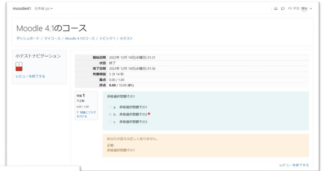
C) ↑ レビュー