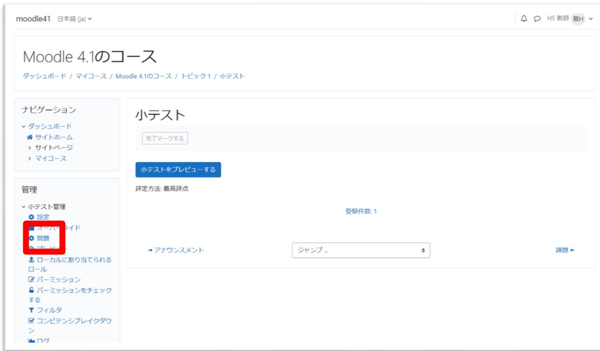
A) ↑ 小テスト