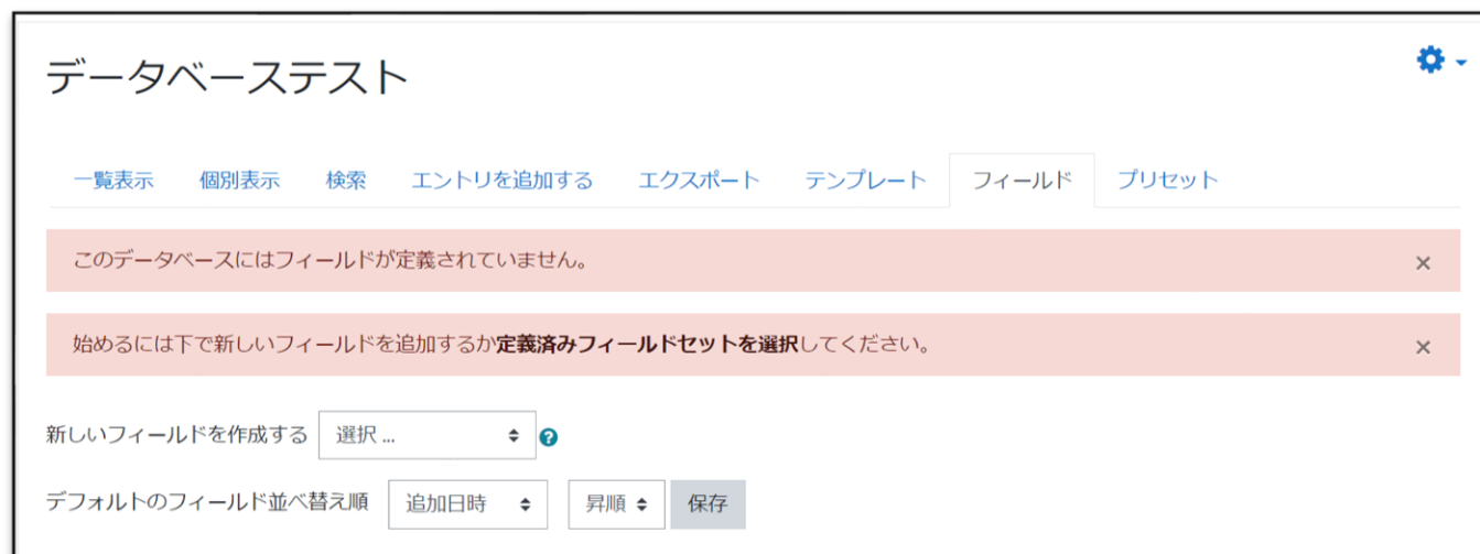
以前の活動作成後の画面 Moodle 3.9 (4.1以前のLTS)