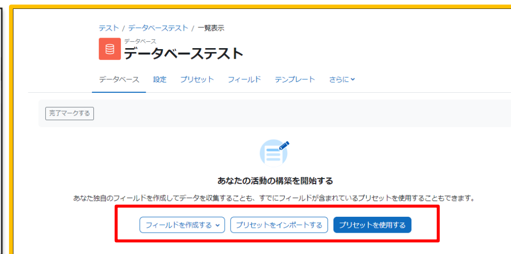
Moodle 4.1の活動作成後の画面